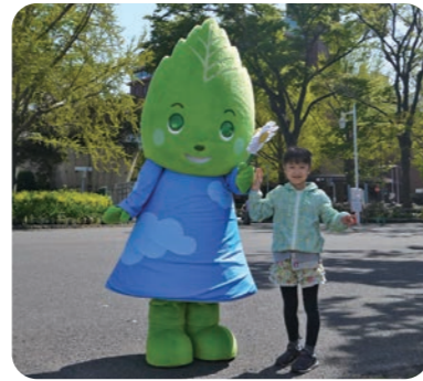
マスコットキャラクターを活用した広報

緑に関するイベントへの出展や、「広報よこはま」等への記事掲載、SNSなど様々な手法を用いて、幅広い年齢層にみどりアップ計画の取組を知っていただけるよう広報を展開しています。