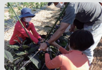
市民農業大学講座 / 保土ケ谷区