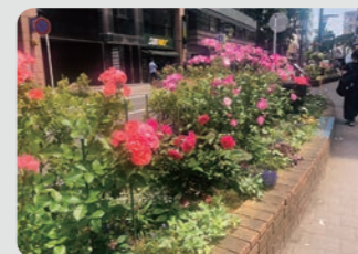
新横浜駅周辺 / 港北区