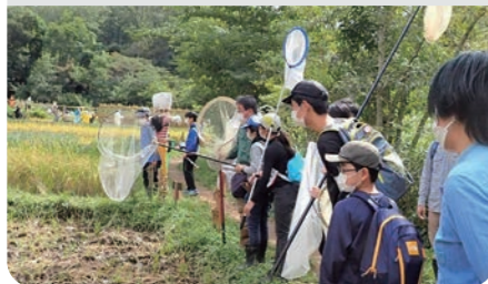
トンボ塾 / 戸塚区

散策など森にふれるイベントやスポット ウェルカムセンター(5か所) 市民の森/ふれあいの樹林 市民の森ガイドマップ/森づくり体験会