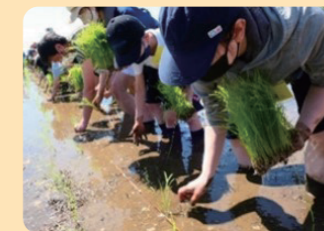
田植え体験 田奈恵みの里 / 青葉区