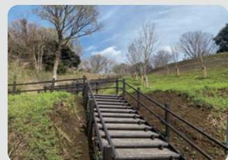
整備した園路 今井・境木市民の森 / 保土ケ谷区