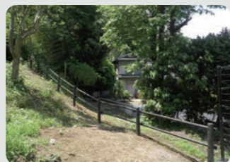
整備した柵など 東寺尾ふれあいの樹林 / 鶴見区