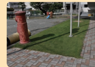
芝生化した園庭 幼稚園 / 旭区

参加者の声 学校にビオトープを導入することで、生き物に興味・関心を持つ生徒が増えました。