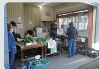
杉田野菜直売所 / 磯子区