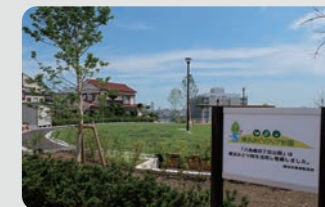
六角橋四丁目公園 / 神奈川区