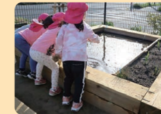
ビオトープの整備 保育園 / 港北区