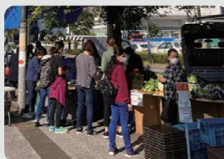
みなとみらい農家朝市 / 西区