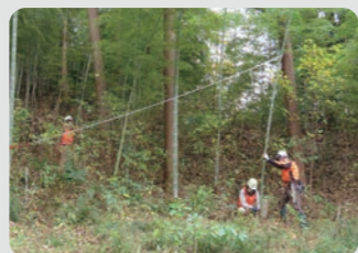
森づくり体験会 池辺市民の森 / 都筑区