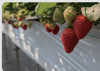
収穫体験農園の開設 / 泉区