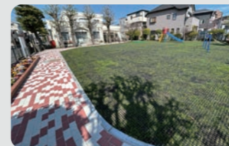
中本牧コミュニティハウス敷地内 こどもの遊び場 / 中区