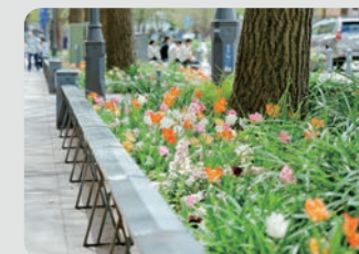
日本大通り / 中区