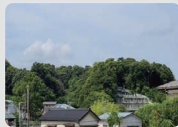
富岡東三丁目特別緑地保全地区 / 金沢区