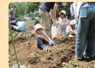
じゃがいも掘り体験 舞岡ふるさと村 / 戸塚区

保育園・幼稚園・小中学校において園庭・校庭の芝生化や生き物とふれあい学べるビオトープの整備、花壇づくり、屋上や壁面の緑化など、多様な緑を創出する取組を推進しました。