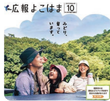
広報よこはま 令和4年10月号