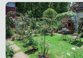
オープンガーデン / 瀬谷区