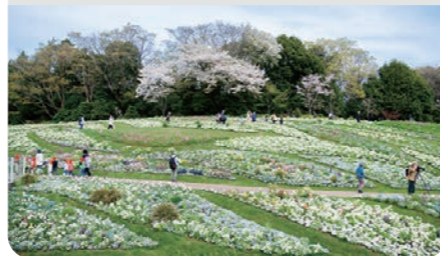
里山ガーデンフェスタ / 旭区

まち歩きなど緑や花にふれるイベントやスポット 花の見どころカレンダー ガーデンネックレス横浜/里山ガーデンフェスタ/都心臨海部等の緑花