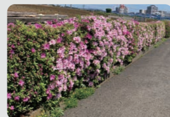
農地縁辺部への植栽 / 都筑区