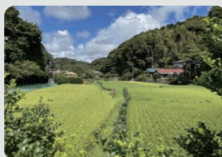
保全された水田 / 栄区