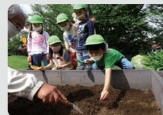
ひまわり栽培交流 / 港南区