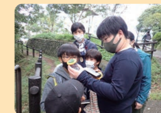
森の中のプレイパーク 南図書館 / 南区

横浜ふるさと村や恵みの里において、農家団体が実施する農体験教室等のイベントの開催を支援しました。