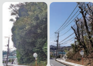
土地所有者による維持管理への支援 作業前後 / 戸塚区