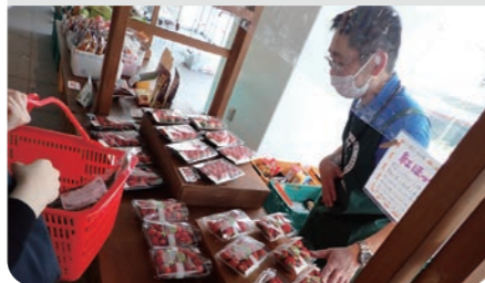
市内産農畜産物の直売 / 中区

農畜産物の直売など農にふれるイベントやスポット 収穫体験農園/市民農園 直売所/マルシェ よこはま産地消サポート店