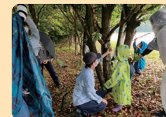
よこはま森の楽校 東洋英和女学院大学 / 緑区

参加者の声 森を探検し、ふしぎなことをたくさん調べることができて、いい経験になったと思う。