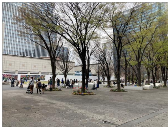
26 緑花による空間づくりと維持管理 （グランモール公園）