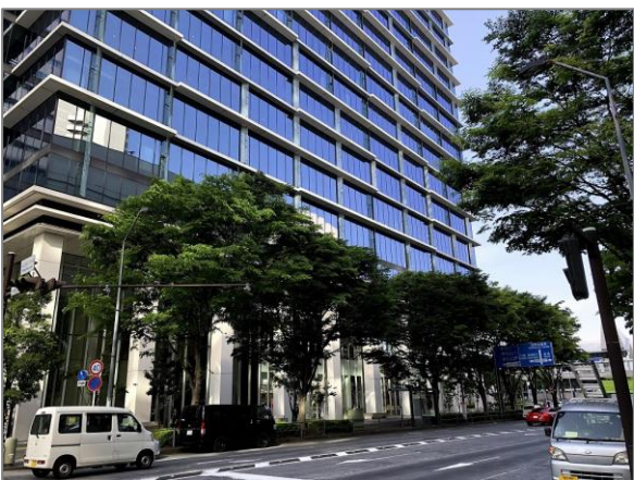
18 街路樹の良好な維持管理 （けやき通り）