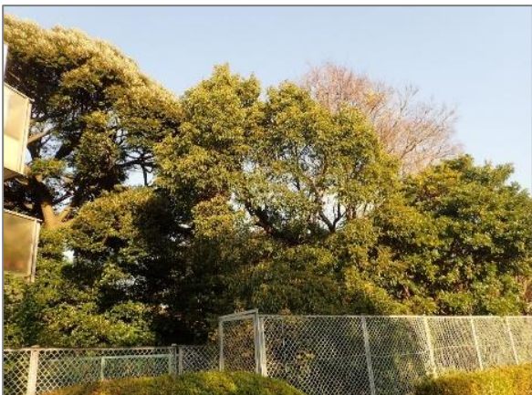
1 緑地保全制度による新規指定 緑地保存地区（南軽井沢）