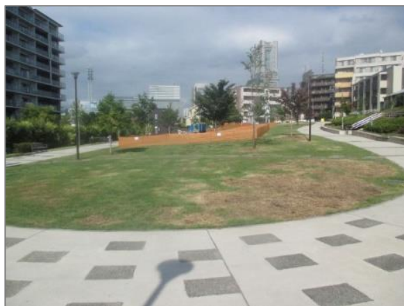
19 シンボリックな緑の創出・育成 （伊勢町もくせい公園）