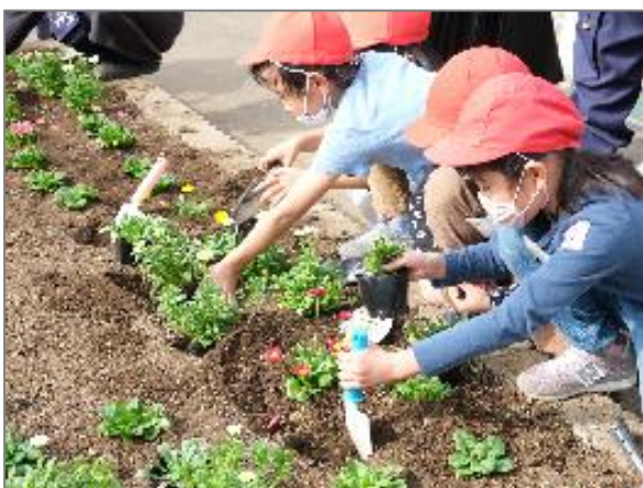
23 緑や花を身近に感じる各区の取組 （区内小学校）