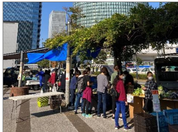
14 青空市・マルシェ等 （みなとみらい農家朝市）