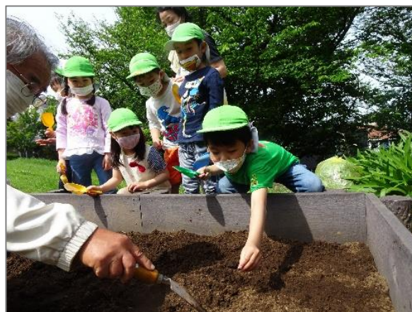
23 緑や花を身近に感じる各区の取組 (区内保育園)