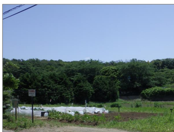
12 市民農園の開設 (野庭町)