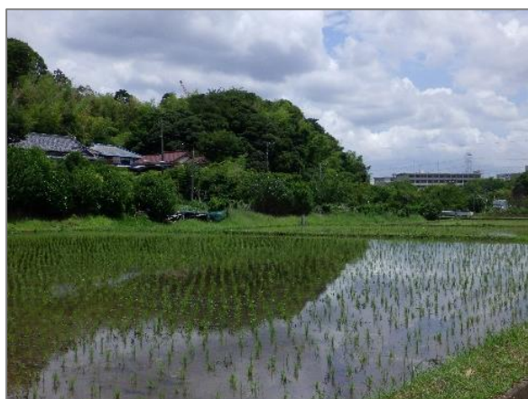
8 水田の保全 (野庭町)