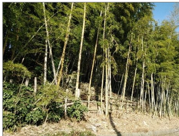
3 樹林地の維持管理の助成 (笹下六丁目)