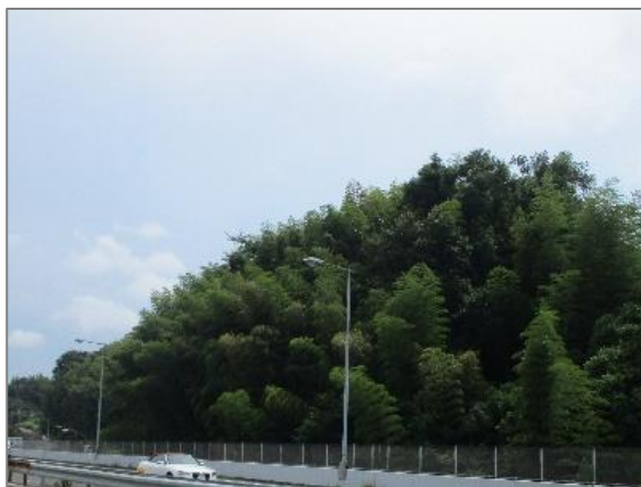
1 緑地保全制度による新規指定 (日野中央特別緑地保全地区)