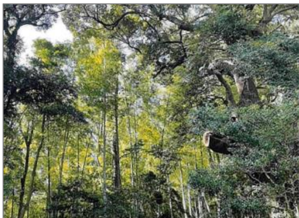
21 名木古木の保存 (金井町)