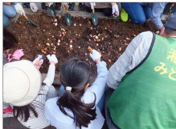
23 地域の花いっぱいにつながる取組 (あさもや公園)