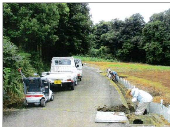
10 農景観を良好に維持する活動の支援 (横浜市栄区长尾台土地改良区)