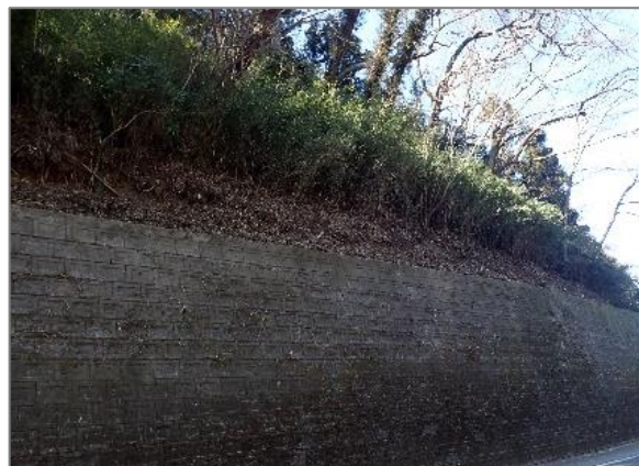
3 樹林地の維持管理の助成 (公田町)