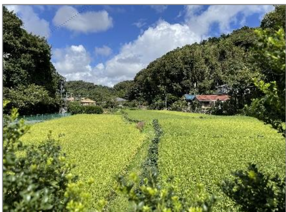
8 水田の保全 (上郷町)