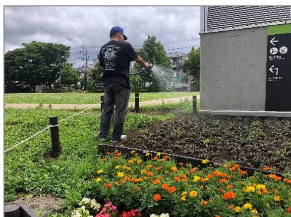
23 緑や花を身近に感じる各区の取組 (二ツ橋公園)