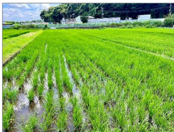
8 水田の保全 (目黒町)