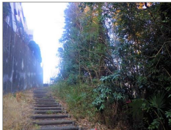
3 樹林地の維持管理の助成 (下瀬谷二丁目)