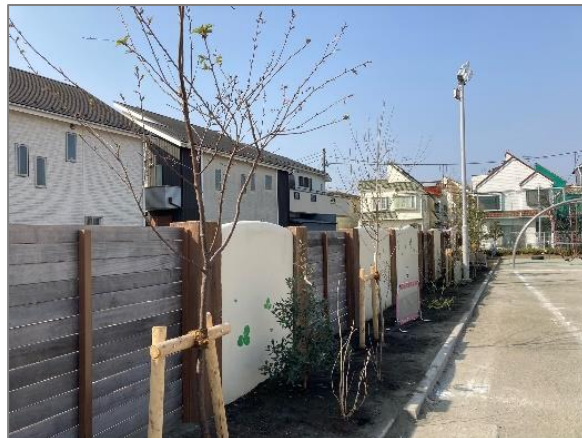
25 幼稚園での緑の創出・育成 (区内幼稚園)