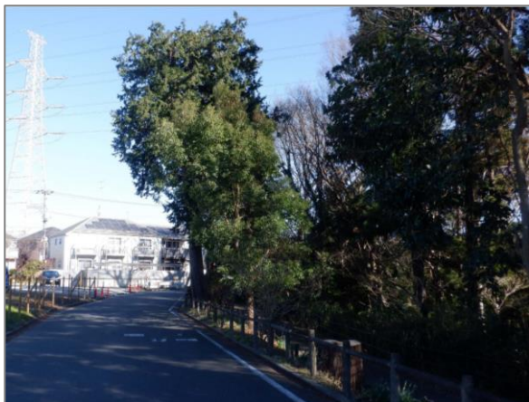
2 森の維持管理 (長屋門公園)