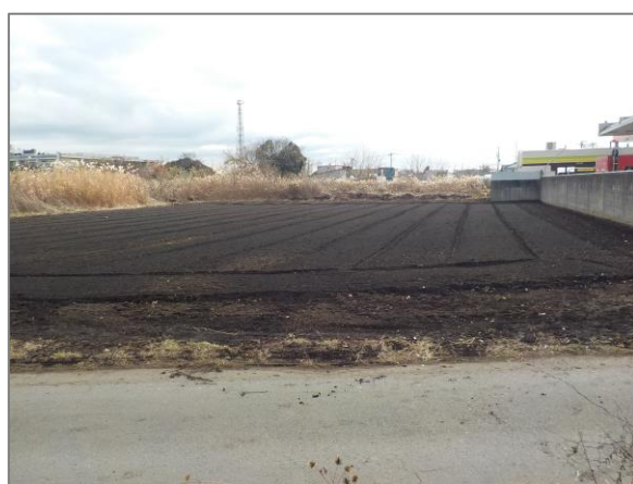
11 遊休農地の復元支援 (中屋敷三丁目)