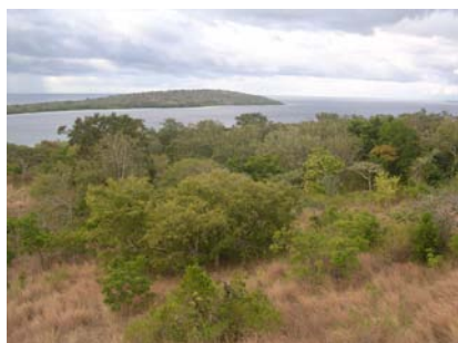
野生の生息地、バリバラト国立公園 Native habitat of Bali Mynah, BBNP

横浜市繁殖センターでは、およそ 100 羽のカンムリシロムクを飼育し、2013 年までに繁殖させた個体 125 羽をインドネシアへ里帰りさせています。また、毎年インドネシアから研修員を受け入れて、飼育、獣医、研究などの様々な分野での研修を行ったり、現地での放鳥に関する技術指導などを行っています。また、生息地の環境回復活動や環境教育も支援しています。PRC holds about one hundred Bali Mynah, and in total of 125 birds have been exported to Indonesia by 2013. PRC has been accepting trainees from Indonesia every year, to provide training programs in various fields such as husbandry and breeding and veterinary, and is supporting the environmental education and environmental restoration activity.