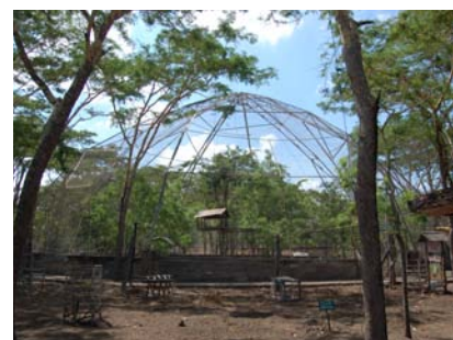
国立公園の放鳥用訓練施設 Training aviary for release in BBNP