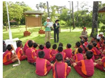
子供たちへの環境教育 Environmental education for children in Indonesia

横浜市繁殖センターは、希少動物の保全と研究を目的に、よこはま動物園ズーラシアの敷地内に設立された施設です。Yokohama Preservation and Research Center (PRC) is established for the purpose of breeding and studying endangered animals. It is located at the breeding zone of Yokohama Zoological Gardens (ZOORASIA).