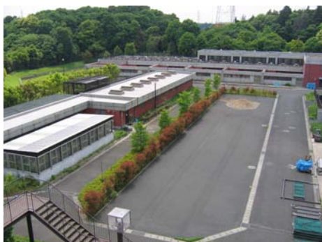
横浜市繁殖センターの繁殖施設 Breeding facility of PRC