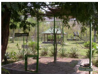
国立公園の繁殖施設 Breeding Center in BBNP