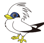
野生のカンムリシロムクの生息数 Wild population of Bali Mynah