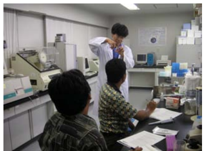
インドネシアからの研修員の受入れ Accepting trainees from Indonesia