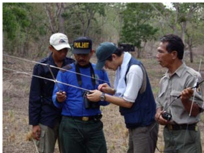
放鳥個体のモニタリング研修 Technical guidance of monitoring wild population