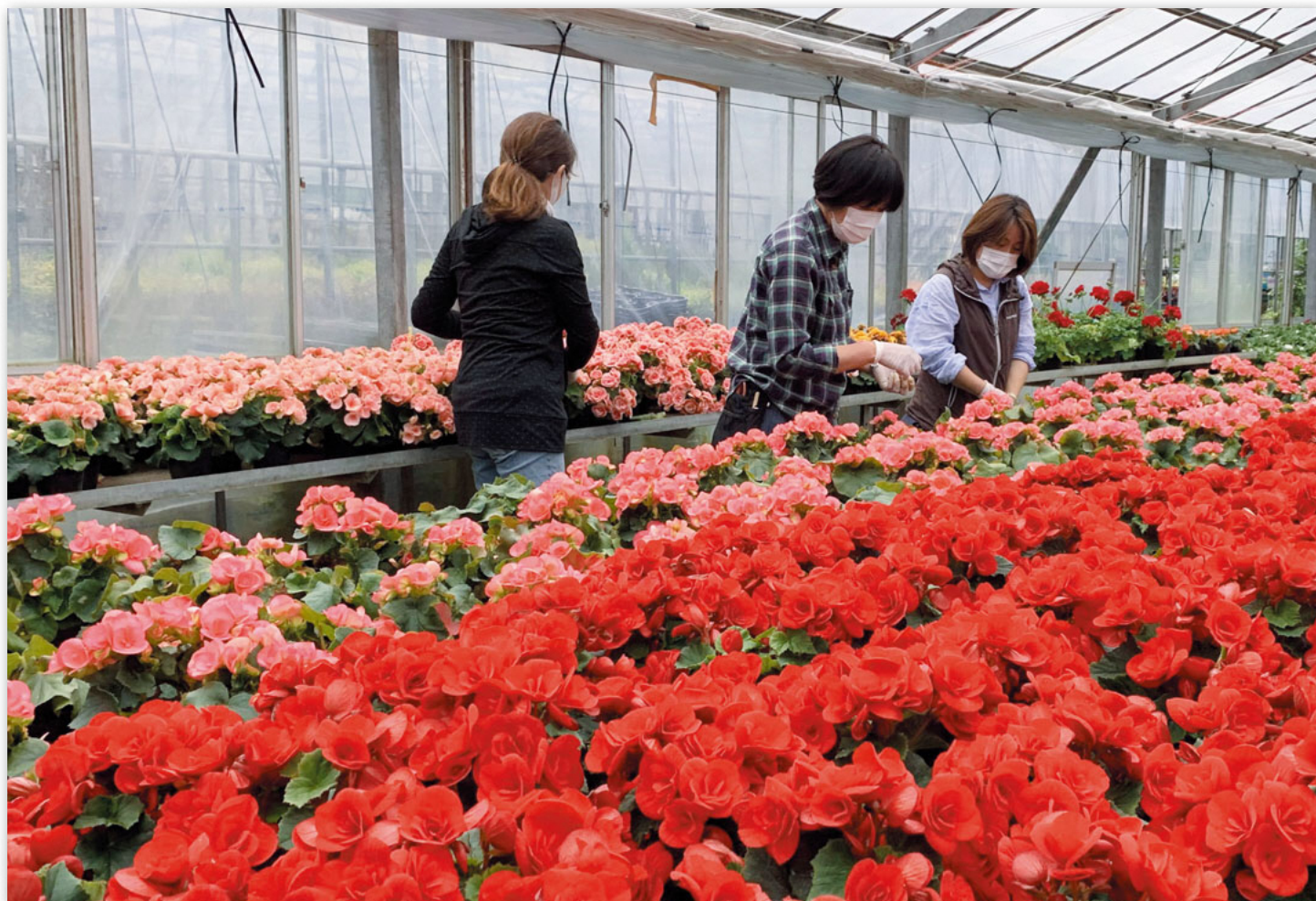
リーガースベゴニアの花から摘み（港南区野庭町 花農場グリーンラブ）