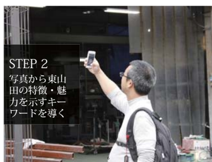
STEP 2 写真から東山田の特徴・魅力を示すキーワードを導く