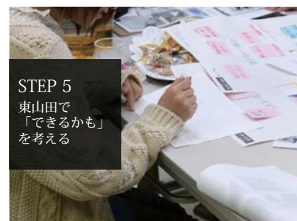
STEP 5 東山田で「できるかも」を考える