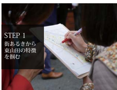
STEP 1 街あるきから東山田の特徴を掴む