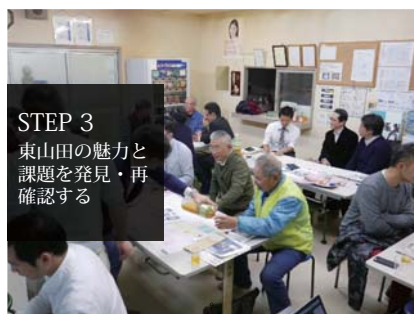
STEP 3 東山田の魅力と課題を発見・再確認する