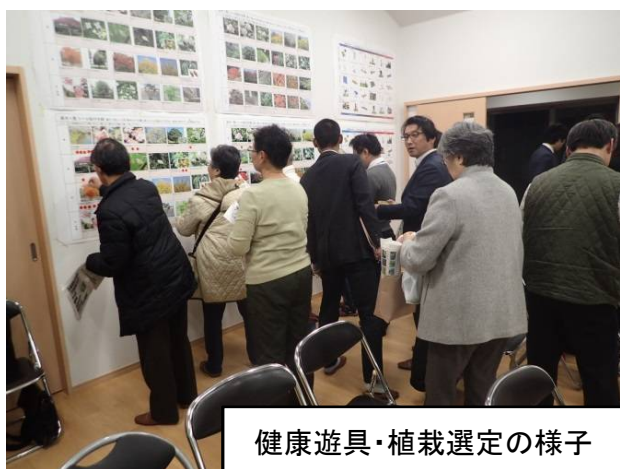
健康遊具・植栽選定の様子