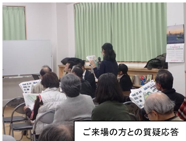
ご来場の方との質疑応答