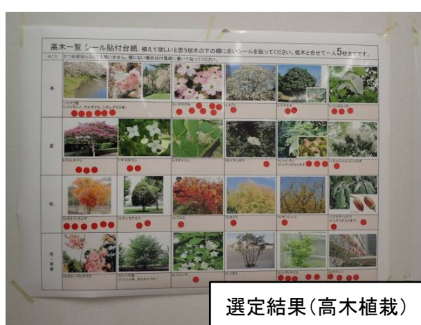
選定結果(高木植栽)

今後の意見交換会の日程は、以下になっておりますので、是非ご参加いただきますようお願いいたします。(詳しくは回覧中のお知らせでご確認ください。)