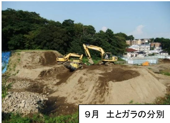
9月 土とガラの分別