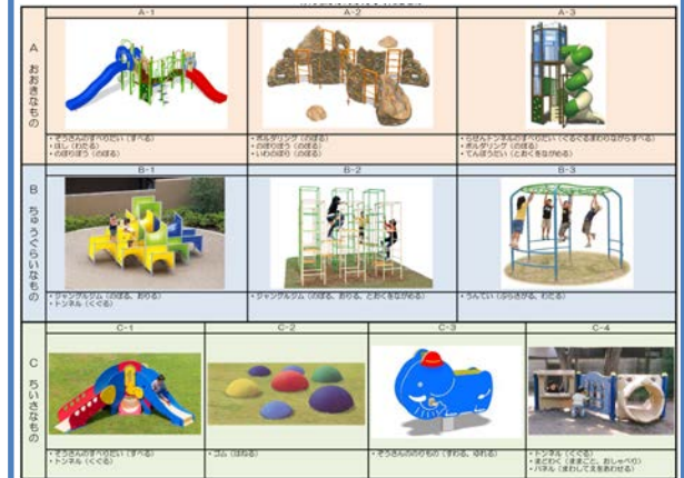
子どもたちのアイデアを基にした遊具の候補リスト

東台小学校の生徒の皆様、ゾウさん広場の遊具のアイデア出しと選定にご協力いただきました。この作業には全校生徒にご参加いただきました。また、近隣のセンター保育園と三松幼稚園の児童の皆様にもご参加いただきました。その後、市とURで遊具の配置等を検討した結果、子どもたちに提示した遊具をほぼ全部設置できることになりました。