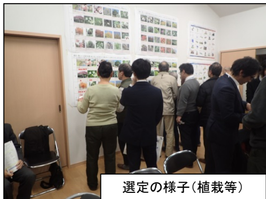
選定の様子(植栽等)