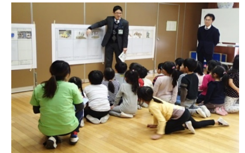
子どもたちによる遊具の選定

平成30年3月20日に開催した最後の意見交換会（第5回）でも、たくさんのご意見をいただきました。 ・公園の名称を公募してほしい。 ・多目的広場からトイレまでの案内板等を設置してほしい。 いただいたご意見やご要望はできるだけ公園の実施設計に生かしていきたいと考えています。