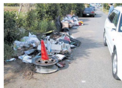
不法投棄が問題となっている地域の様子