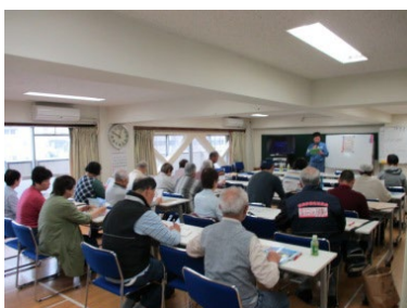
住民説明会の様子