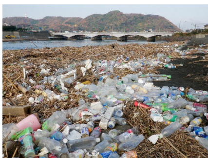
川岸のプラスチックごみ