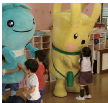
イーオやミーオが登場するかも？