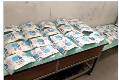
▲紙パックをかわかしているよ