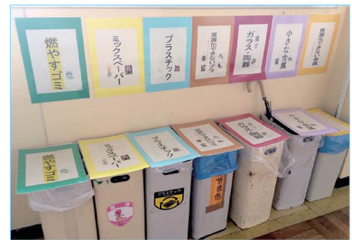
▲みんなの学校でも分別しているかな

学校だけではなく、会社や工場の人たちも、ごみを分別してリサイクルに協力しているよ。