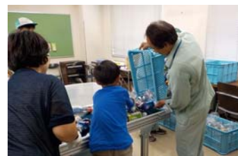
缶・ペットボトルの選別作業体験