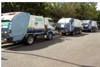
ごみ収集車体験乗車体験