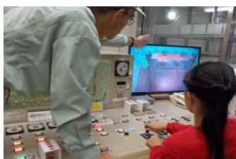
せん断式破砕機の操作体験