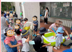
えんにちあそび 令和5年7月21日(金)