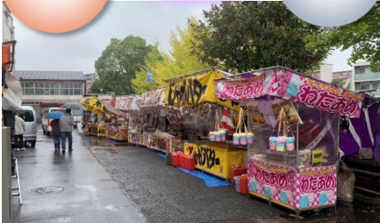
秋ふれあい祭り令和5年10月15日(日)