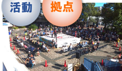
商店街プロレス令和5年9月17日