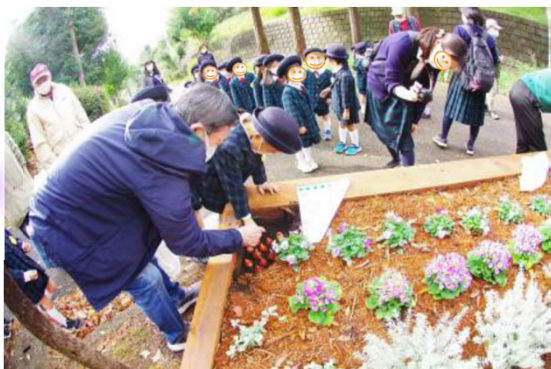
幼稚園児とオアシス交差点花壇の花苗植えの様子