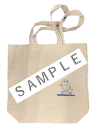
水道局オリジナルトートバッグ