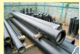
▲水道局で備蓄している水道管