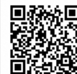
回答用ページの 二次元コード

「ログインID」と「パスワード」は、一人の方が郵送による回答を含め、重複して回答することを避けるためのものです。個人を特定するためのものではありません。 「ログインID」と「パスワード」は、郵送によりご回答いただく方は使用しません。