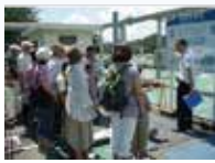
Thăm hiện trường WTP

Nhiều hoạt động đã được thực hiện để nâng cao ý thức và nhận thức của người dân, ví dụ như thăm công trình thoát nước, giáo dục học sinh, sinh viên và tổ chức các diễn đàn công cộng.