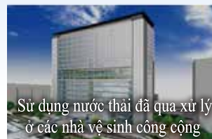
Sử dụng nước thải đã qua xử lý ở các nhà vệ sinh công cộng

Nước thải đã qua xử lý được sử dụng để vệ sinh/làm lạnh máy móc, rửa nhà vệ sinh và tưới cây ở các công trình công cộng