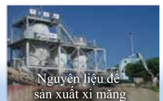
Nguyên liệu để sản xuất xi măng