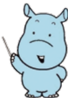
Dai-chan: Biểu tượng của Phòng Quy hoạch Môi trường Thành phố