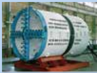
Máy bảo vệ đường hầm

Hệ thống thoát nước mưa của thành phố gồm các hệ thống thoát nước riêng và hệ thống thoát nước chung nhằm phát triển nhanh và hiệu quả. Ở các khu vực đô thị, các phương pháp kích ống và khoan hầm ít gây tác động tới luồng giao thông được sử dụng để lắp đặt đường ống thoát nước.