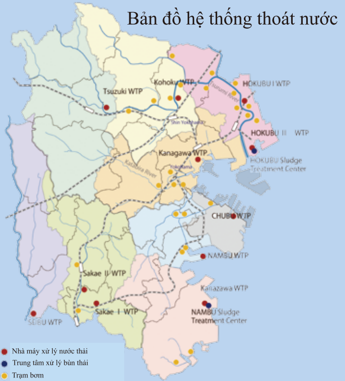
Bản đồ hệ thống thoát nước