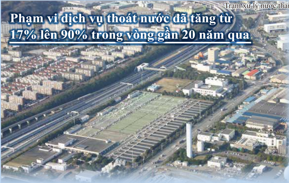
Trạm xử lý nước thải

Phạm vi dịch vụ thoát nước đã tăng từ 17% lên 90% trong vòng gần 20 năm qua