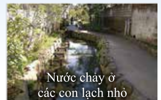
Nước chảy ở các con lạch nhỏ