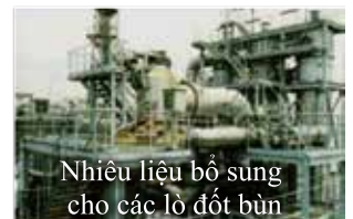
Nhiên liệu bổ sung cho các lò đốt bùn