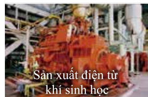
Sản xuất điện từ khí sinh học

Khí phân hủy được sử dụng cho động cơ sản xuất điện từ khí đốt và cung cấp nhiên liệu cho các lò đốt ở nhà máy xử lý bùn thải