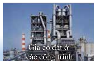
Giả cố đất ở các công trình

Tro bùn được sử dụng để cải tạo đất và cung cấp nguyên liệu thô sản xuất xi măng phục vụ các công trình xây dựng