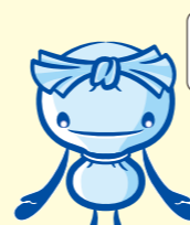
へら星人 ミーオ "Mio"

Commencez par un tri sélectif de «Papier» Récipients et emballages plastique «Déchets combustibles».