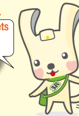
「ヨコハマ資源リサイクル」マスコット イーオ "Io"

Effectuez le tri de vos déchets dès que vous les avez, afin d'éviter des mélanges des récipients et emballages plastiques dans des déchets combustibles.