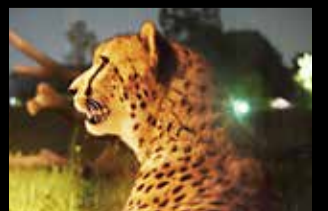
Guepardo en Zoorasia

Alumnos de primaria y secundaria básica: ① y ② 200 yenes (Todos los sábados, la entrada de ① y ② es gratuita para los alumnos de primaria, secundaria básica y secundaria superior (es necesaria una tarjeta de identificación como estudiante)).