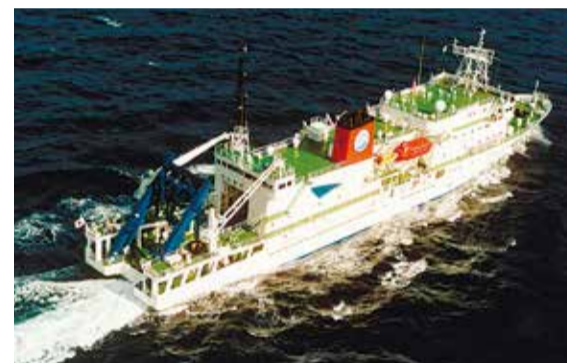
Barco de investigación de mares profundos KAIREI.

Contacto: Secretariado de Administración