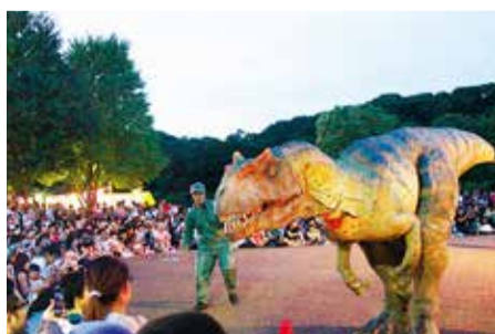
El espectáculo de dinosaurios en vivo goza de gran popularidad.