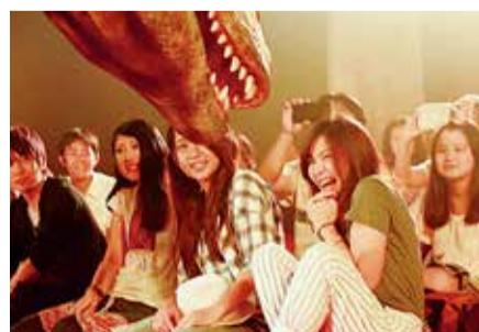
¡Los dinosaurios se aproximan amenazadores frente a nuestros ojos!

En Zoorasia se lleva a cabo "DINO-A-LIVE", un espectáculo de experimentación en vivo en el que aparecen frente a los espectadores dos feroces dinosaurios carnívoros. El especialista en dinosaurios "Kyoryu-kun" ofrece una charla sobre estos reptiles en la que niños y adultos se pueden divertir en grande. También se lleva a cabo el evento "Summer Night Dinosaurus (Dinosaurios en una noche de verano)", en el que los visitantes pueden participar de manera gratuita.