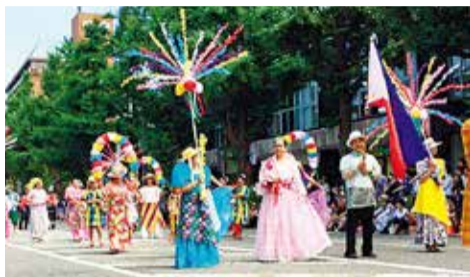
Desfile completamente cosmopolita