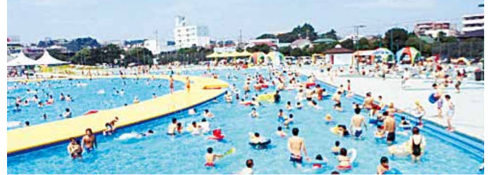
Piscina tipo río en Yokohama Pool Center

Tel.: 045-640-0055 Fax.: 045-640-0024 Portal en Internet: http://www.hamaspo.com