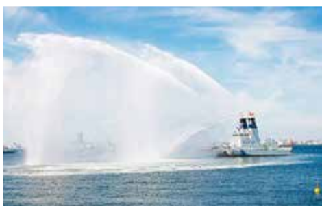
Demostración de salvamento marítimo