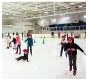
Patinemos sintiéndonos completamente libres en la pista principal.

En Ice Arena del Banco de Yokohama, inaugurada en diciembre del año pasado, se puede patinar a lo largo y a lo ancho de la pista principal de estándares internacionales que se usa para competiciones tales como patinaje artístico y hockey sobre hielo. También hay una pista adicional donde incluso los principiantes pueden patinar de manera pausada. Ya sea que tengan experiencia de calzar las botas de patinaje o no, les invitamos a olvidarse del calor del exterior mientras se divierten patinando y sintiéndose al mismo tiempo refrescados en las agradables pistas cubiertas. La instalación también está aceptando solicitudes para quienes desean tomar clases de diversos tipos de patinaje. Si desean más detalles al respecto, sírvanse consultarlo con Ice Arena del Banco de Yokohama.