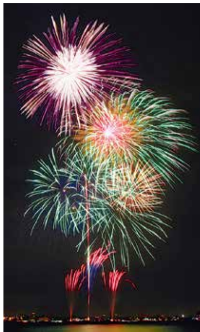
Fuegos artificiales que adornan el cielo nocturno del puerto.

El cielo nocturno se embellece con 3.000 fuegos artificiales cada día. Les invitamos a disfrutar de los encantos del mar y el puerto de Yokohama, tales como el desfile de barcos en el mar y el desfile con un toque cosmopolita en la avenida Yamashita Koen-dori, así como los restaurantes y bares, etc. que hay en el parque.