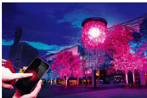
También habrá producciones tipo participativo mediante el uso de teléfonos inteligentes y otros dispositivos.

¡Además va a haber espectáculos de iluminación en el Parque Yamashita y en el Parque Yokohama, así como en otros lugares.