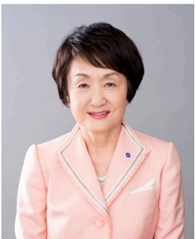
Fumiko Hayashi Alcaldesa de Yokohama

La Copa Mundial de Rugby 2019 y los Juegos Olímpicos y Paralímpicos Tokio 2020, dos eventos deportivos internacionales, se van a celebrar durante dos años consecutivos en Yokohama. Serán “dos años sin precedentes”. Y por fin, a partir de ahora, daremos inicio a los preparativos a escala total, en vista de esta oportunidad de ser el centro de la atención masiva en todo el mundo.