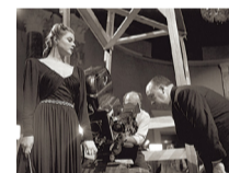
Hollywood, 1946 Robert Capa © ICP/Magnum Photos

Les invitamos a disfrutar de los rostros de las estrellas cinematográficas de antaño, desde Marilyn Monroe hasta Yujiro Ishihara, teniendo como telón de fondo la ciudad de Yokohama.