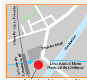
Pasarela próxima a la salida este de la estación de Totsuka

A la venta en DVD/Blu-Ray a partir del 6 de febrero (miércoles)