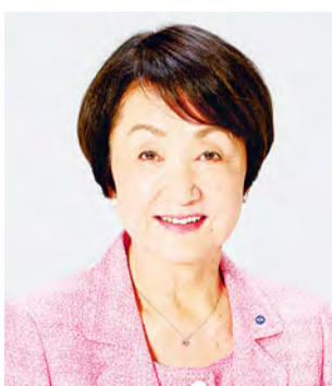
Fumiko Hayashi Alcaldesa de Yokohama

Yokohama está desbordando de encantos y atracciones. Un puerto donde navíos de otros países vienen y van, edificios de estilo occidental que exaltan la historia de la ciudad, desde los días de apertura de su puerto, el Jardín Sankeien, el Barrio Chino, y una moderna y elegante extensión costera. Sus distritos periféricos son bendecidos por una riqueza de verde y permiten que disfrutemos del cambio de estaciones en sus áreas forestadas.