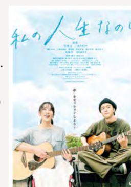
© 2018 "Watashi no Jinsei Nanoni" Film Partners

Mizuho (Jiyoung), la protagonista, queda paralizada de la cintura para abajo debido a un infarto de la médula espinal que sufrió mientras practicaba gimnasia rítmica. Entonces ella se encuentra con Junnosuke (Yu Inaba), un músico que era su amigo de infancia. La película muestra como ella redescubre el sentido de vivir bajo la magia de la música que ella toca con su guitarra. Muchas de las escenas de esta película fueron filmadas en el Barrio Totsuka. La escena en que Mizuho y Junnosuke se encuentran para presentarse en vivo en la calle fue filmada en la pasarela próxima a la salida este de la estación de Totsuka.