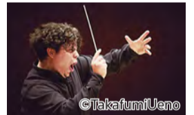
▲ Andrea Battistoni