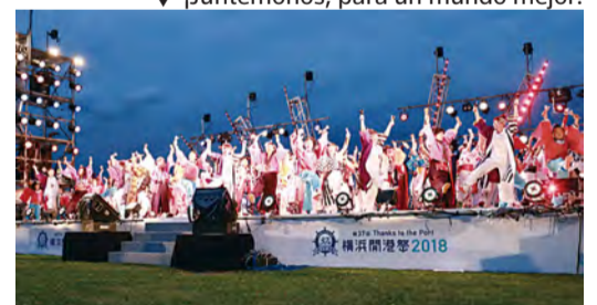
▼ ¡Juntémonos, para un mundo mejor!