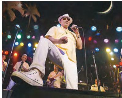
▲ CRAZY KEN BAND