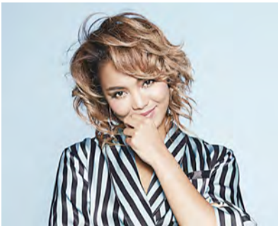
▲ Crystal Kay

Local: Escenario especial del Muelle Yamashita