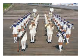
▲ Banda del Cuerpo de Bomberos de Yokohama

Como parte del proyecto de desarrollo de nuevos talentos del Yokohama Otomatsuri 2019, desde junio a octubre de este año la Banda del Cuerpo de Bomberos de Yokohama estará visitando las bandas de metales de 27 escuelas de enseñanza media de toda la ciudad para la realización de talleres prácticos. Los estudiantes que participen de estas talleres prácticos se presentarán este año como parte de este "Proyecto Música en las Calles" para demostrar todo lo que aprendieron.