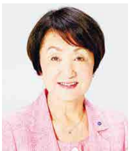
Fumiko Hayashi Alcaldesa de Yokohama

Más de 150 años después de la fundación del Yokohama Football Club, el primer club de rugby de toda Asia, el año 1866, se levantará la cortina para la RWC 2019 JAPAN, la primera Copa del Mundo de Rugby con sede en Asia, el 20 de septiembre.