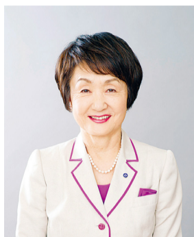
Fumiko Hayashi Prefeita da Cidade de Yokohama

No dia 4 de dezembro tem início a “Semana dos Direitos Humanos”. Gostaria de convidar a todos a refletirem comigo sobre a forma de criar uma sociedade na qual todas as pessoas possam viver felizes e despreocupadas, independentemente da idade, sexo, nacionalidade ou se são portadoras de deficiência ou não.