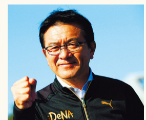
Convidado especial: Toshihiko Seko, Técnico-geral da DeNA Running Club

O "Hamasta Ekiden" é um evento de corridas realizadas em rotas especiais dentro do Estádio de Yokohama que conta com a participação dos visitantes. As pessoas não só participam de corridas, como também podem se divertir em um grande número de eventos sem necessidade de reserva antecipada. Além de barracas de comida e abertura gratuita de bancadas, há um curso gratuito sobre corridas em que as crianças poderão participar. Para mais informações, por favor, consultem o website da cidade na Internet.