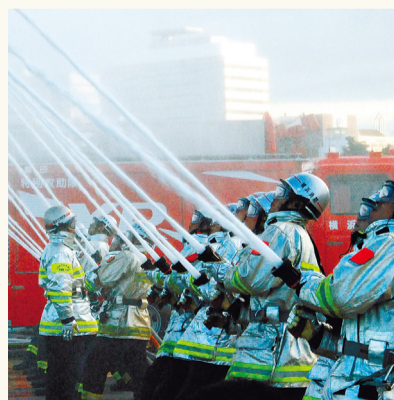
Vale a pena presenciar o espetáculo principal: descargas simultâneas de água

Para mais informações, por favor, consultem o website da cidade na Internet.