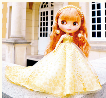
Blythe © 2016 Hasbro. All Rights Reserved. Licensed by Hasbro

Este ano, com a chegada do seu 15º aniversário, um grande número de bonecas Blythe está sendo exposto no Museu de Bonecas de Yokohama. Até agora, foram fabricadas cerca de 500 bonecas Blythe, e a exibição é feita principalmente com bonecas selecionadas entre as melhores.