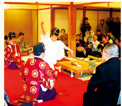
Cerimônia de faca de cozinha, um ritual tradicional para preparação de alimentos em que são usados apenas pauzinhos e faca, evitando tocá-los com as mãos.

Durante o período do ano novo, o interior da Kakushokaku (antiga residência da família Hara), uma propriedade cultural tangível designada pela cidade de Yokohama, será aberto para visita pública, algo que não acontece normalmente. Trata-se de um lugar cheio de história e de enorme valor que abrigou artistas de Nihon Bijutsuin, tais como Yokoyama Taikan e Shimomura Kanzaan, para a confecção de seus trabalhos. Durante o período de abertura ao público será possível ouvir um concerto de koto e admirar uma cerimônia de faca de cozinha, entre outras atividades.