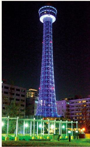
Stardust Illumination (Iluminação de poeira estelar)

Como se fosse uma chuva de estrelas... Assim é a iluminação que flui em forma descendente a partir do topo da seção central da torre. Na praça, encontra-se o espaço fantástico "HIKARI GARDEN", onde as pessoas podem apreciar a arte da luz. Recomendamos-lhes como um lugar para tirar fotos.