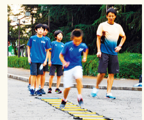
Curso gratuito de corridas