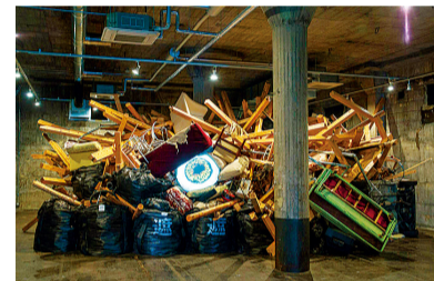
«Project God-zilla — Landscape with an Eye —» 2016

Como se poderia deduzir de seu título, “Projeto God-zilla - Paisagem com um Olho -”, a obra de Yukinori Yanagi exibe um enorme olho arregalado saído de uma pilha de restos de madeira, aparelhos elétricos e outros tipos de lixo.