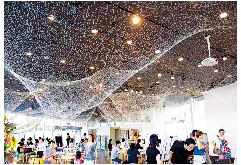
Cena de uma alba panorâmica anterior

Contato: Secretaria Tel.: 045-661-0602 Fax: 045-661-0603