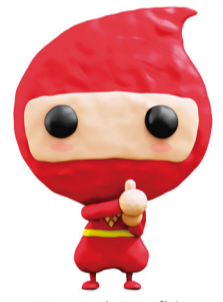
Mascote do Benefício Kaku-ninja

6 de setembro de 2017 (com carimbo postal até esta data)