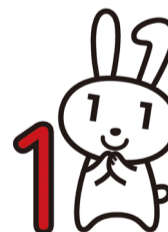
Personagem do My Number Maina-chan

* Notificação: Um cartão que o informa o seu My Number (número pessoal)