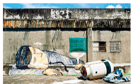
Bala de passarinho «Office Worker» 2016