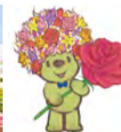
Mascote da feira: Urso Jardineiro

【Período】 3 de maio (sexta-feira, feriado) a 2 de junho (domingo)