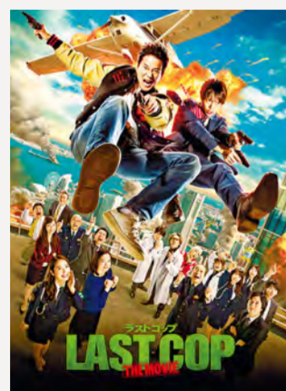
© 2017 The Movie "Last Cop The Movie" Comitê de Produção