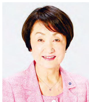
Fumiko Hayashi Prefeita de Yokohama

Feliz Ano Novo a todos! Eu sinceramente espero que tenham entrado no ano novo com segurança e boa saúde. Neste ano, Yokohama celebrará o 160º aniversário da inauguração de seu porto e realizará uma série de eventos que elevarão ainda mais a estatura de Yokohama como cidade internacional. Estamos determinados em fazer de 2019 um ano frutífero no qual Yokohama dará mais um salto, com a colaboração de todos vocês.