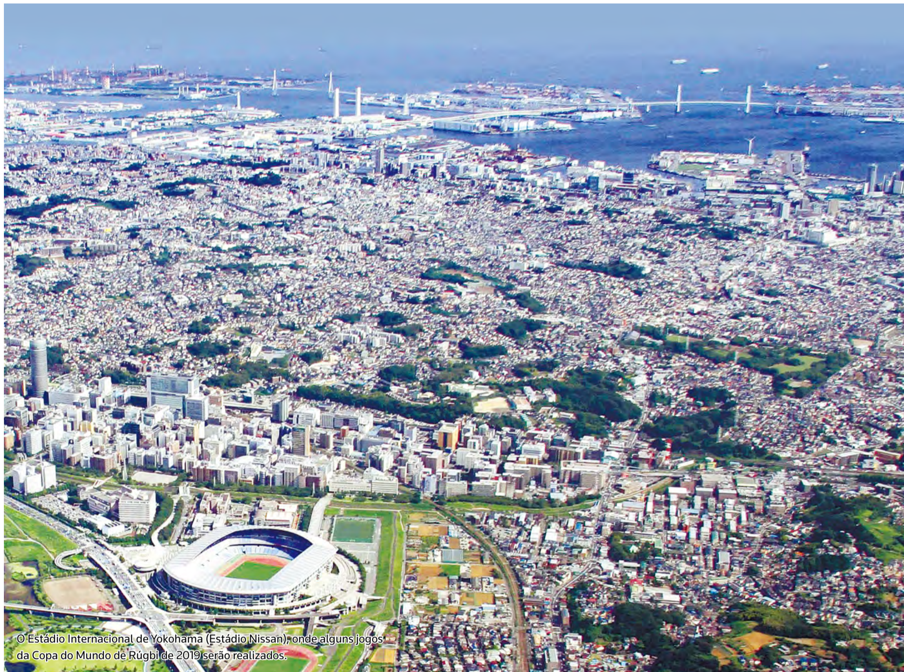
© Estádio Internacional de Yokohama (Estádio Nissan), onde alguns jogos da Copa do Mundo de Rúgbi de 2019 serão realizados.