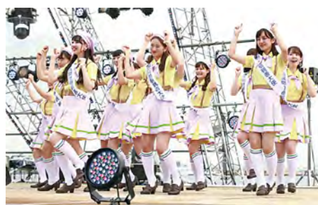
▲ Apresentação especial da "Hamakko", a unidade de dança feminina de Yokohama

Locais: Parque Rinko, Distrito Minato Mirai 21, Distrito Shinko e vizinhanças