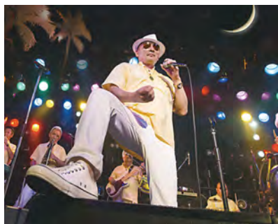
▲ CRAZY KEN BAND