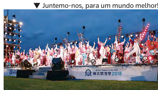
▼ Juntemo-nos, para um mundo melhor!