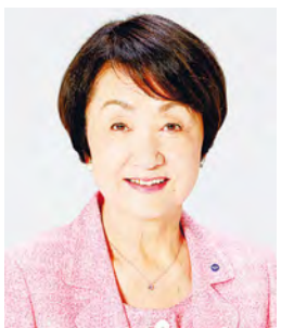
Fumiko Hayashi Prefeita de Yokohama

O Festival do Porto de Yokohama é o evento sazonal que define o início do verão em Yokohama! Neste ano, tendo em vista que o Porto de Yokohama celebra o 160º aniversário de sua abertura ao mundo, esperamos ansiosamente trabalhar juntos com os cidadãos, empresas e organizações de Yokohama para celebrar este aniversário marcante em grande estilo.