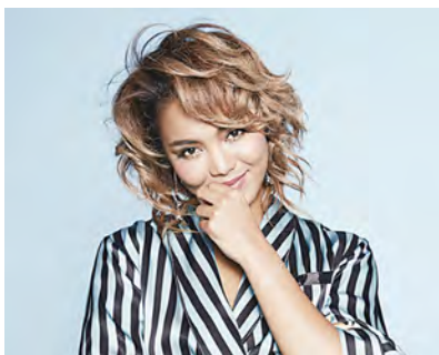
▲ Crystal Kay