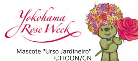
Mascote "Urso Jardineiro"

Desde a abertura do Porto de Yokohama, as rosas têm desempenhado um papel importante nas vidas dos cidadãos de Yokohama. Neste ano lançaremos um evento completamente novo, a "Semana da Rosa de Yokohama", para focar sobre esta flor. Começando com o principal evento a ser apresentado, a "Festa da Rosa 2019", diversos outros eventos e atividades relacionados com a rosa serão realizados durante o Mês da Abertura do Porto de Yokohama, colorindo a cidade com tons de rosa durante o 160º aniversário da abertura do Porto de Yokohama ao exterior. Durante o respectivo festival, tanto cidadãos como visitantes poderão desfrutar da rosa nas vistas e panoramas que transmitem a história da abertura do porto, saboreando doces com o tema da rosa e outras delícias.