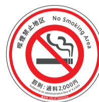
Sinal de superfície das estradas da zona livre de fumantes