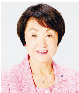
Hayashi Fumiko Prefeita de Yokohama

De maneira a prevenir a disseminação de infecções pelo novo corona vírus, a cidade de Yokohama está tomando medidas para priorização da saúde e segurança de todos seus cidadãos. Nossa primeira prioridade é a saúde e a segurança de nossos estudantes do ensino elementar, fundamental e médio, portanto, todas as 510 instituições municipais de ensino elementar, fundamental e médio de Yokohama foram fechadas temporariamente. Com relação às instalações utilizadas pelo público, também fechamos todas nossas instalações com exceção de instituições de bem-estar selecionadas e outras. Ainda, foram cancelados ou adiados para uma data posterior todos os eventos públicos planejados e outras atividades patrocinadas pela cidade. Queremos, ainda, agradecer do fundo do nosso coração a todos os organizadores e cidadãos de Yokohama pela sua grande compreensão e cooperação.