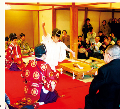
不用手撫摸，只使用筷子和刀妥善處理食材的傳統儀式，刀工儀式

將平時看不到的市指定有形文物的鶴翔閣(舊原家住宅)的內部在正月期間公開。曾經，有橫山大觀、下村觀山這樣的日本美術院的畫家為了創作活動在這裏逗留過的具有歷史意義的珍貴場所。在此期間，還進行箏曲演奏以及刀工儀式。