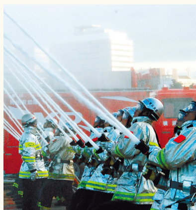
壓卷的同時放水值得一看