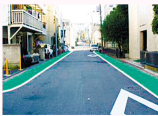
安心顏色地帶 施工後

除了新增配置主任學校社工之外，在所有中學校區等配置一條龍學校型咨商心理師。強化為了銜接到早期發現・解決的體制。