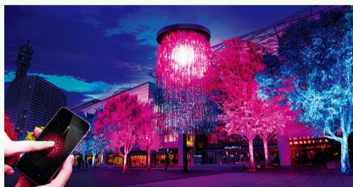
使用智慧手機放主題花的櫻花・鬱金香・玫瑰的數碼煙花，變成光之藝術空間