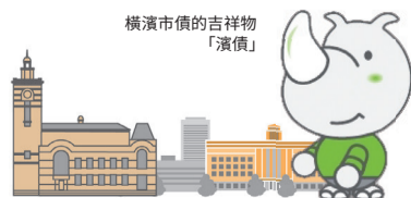
橫濱市債的吉祥物「濱債」