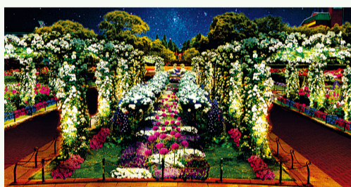
玫瑰花的拱圈變成光照隧道。花卉變成光照地毯