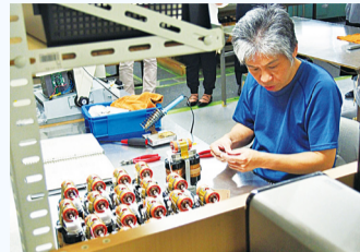
X 射線發生裝置的製造現場