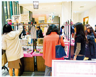
生氣勃勃女性創業家宣傳周