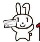
個人編號吉祥物 愛娜