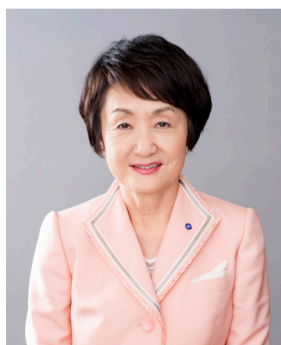
橫濱市長 林 文子

平成29年度是「橫濱市中期四年計畫 2014~2017」總結之年。爲了發展支撐橫濱的「現在」和致力於開往「未來」的措施，從育子・教育・福祉・醫療・防災・減災・活化經濟到城市建設，推進至各個領域，面向完成計畫目標，再次全力以赴採取舉措。另外，也好好對應凌辱問題以及上學路的安全對策、兒童貧困對策等吃緊課題，推進計畫的前瞻性措施。