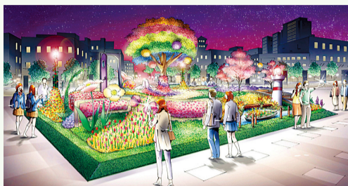
以象徵吉祥物的花園熊為母題的展覽會之象徵花園。一被光照就變成夢幻氛圍