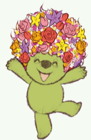
象徵 吉祥物「花園熊」 © ITOON/GN2017