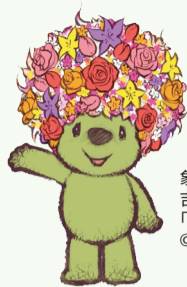
象徵 吉祥物 「花園熊」

從5月上旬開始，將迎來市花的「玫瑰花」的賞花時節。在橫濱展各個會場的玫瑰花園，改變賞花主題，符合其主題的各種各樣品種的玫瑰花將百花齊放。請您飽嘗形形色色的玫瑰花的媲美。