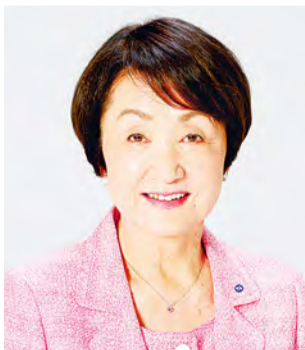
橫濱市長 林 文子