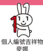
個人編號吉祥物 麥娜