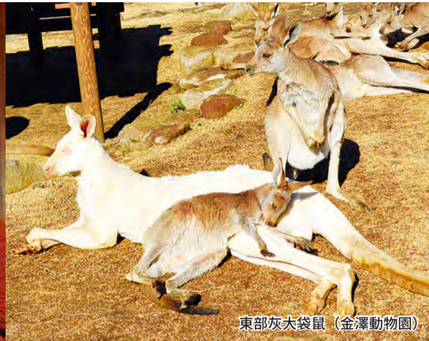
東部灰大袋鼠 (金澤動物園)