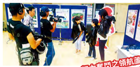
用垃圾袋製作簡單雨衣