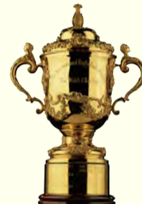
TM © Rugby World Cup Limited 1986. All rights reserved.

此外，套票自1月19日(週五)，普通票自2月19日(週一)以JRFU會員俱樂部，Sunwolves官方粉絲俱樂部會員等為對象實施先行抽籤銷售。