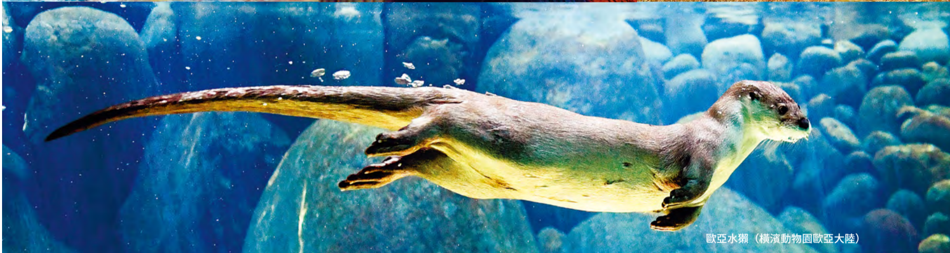
歐亞水獺 (橫濱動物園歐亞大陸)