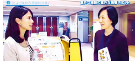
介紹男女共同參與中心橫濱之資訊圖書館