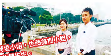
在山下公園拍攝片頭景