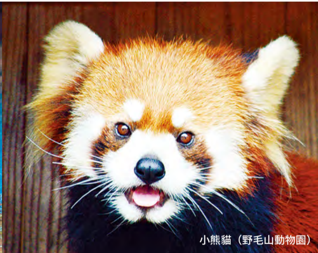
小熊猫 (野毛山動物園)