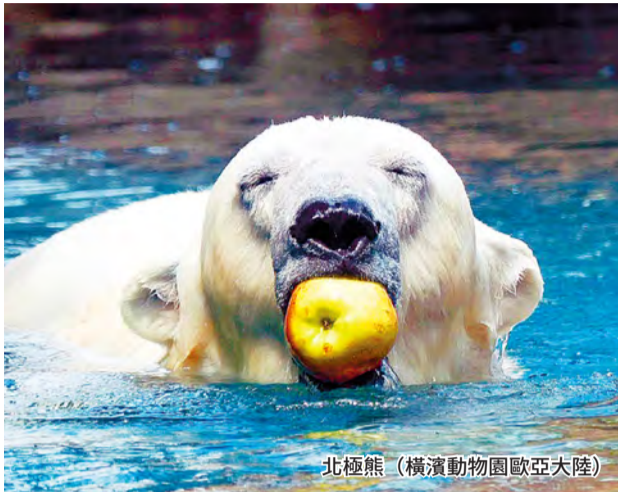
北極熊 (橫濱動物園歐亞大陸)