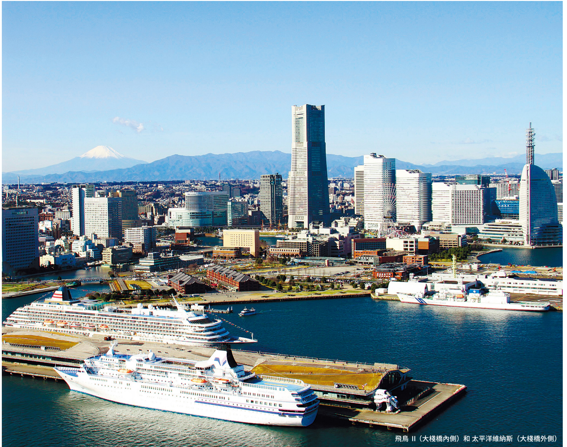
飛鳥 II (大棧橋內側) 和 太平洋維納斯 (大棧橋外側)