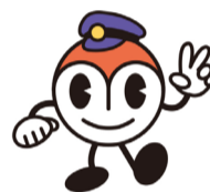
市營交通形象吉祥物 「Hamarin」