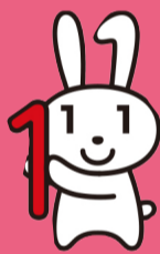
個人編號吉祥物 麥娜

申請過個人編號卡，還沒有領取的人士，請確認好領取方法，儘早領取。即使交付通知書(通知明信片)上記載的領取期限已過，也在交付個人編號卡。