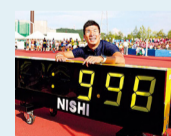
「桐生、9秒98的壯舉」 男子田徑賽 100米日本人首創 9秒98 記錄的桐生祥秀選手(2017年9月9日，福井運動公園田徑比賽場)