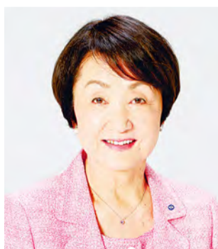
橫濱市長 林 文子

柔和的清風與五月萬里無雲的晴朗天空。鳥兒的歡聲讓人心情舒暢，嫩葉的綠色讓人產生愉悅的美好感受。我們迎來了一邊接觸時令花卉和大自然，一邊享受步行樂趣的季節。