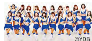
作為講師，橫濱 DeNA BayStars 官方表演隊 Diana 也將出場。

【關於報名的諮詢】執行委員會（文化觀光局內） 電話：045-663-1365 傳真：045-663-1928