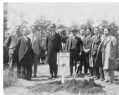
種植西雅圖玫瑰的情形

針對 1923 年關東大地震中遭受巨大損失的橫濱，美國西雅圖的日本人會提供了援助。