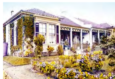
當時山手的洋館的情形