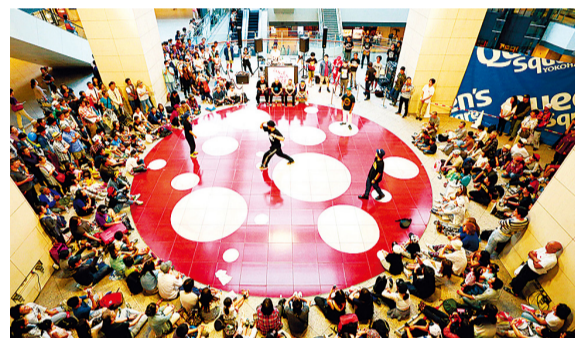
② BATTLE DELIGHT -ALL STYLE SOLO BATTLE-