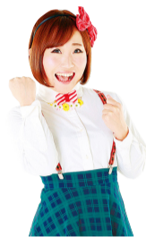
金太郎。女士 參加閉幕式特別 節目！

9月30日是Dance Dance Dance @ YOKOHAMA 2018的最後一天，在這一天裡，參加舞蹈樂園的全體舞蹈演員和觀眾匯聚一堂，大家一同演繹原創舞蹈「Red Shoes」，我們將以此形式舉辦一場規模浩大的閉幕式。