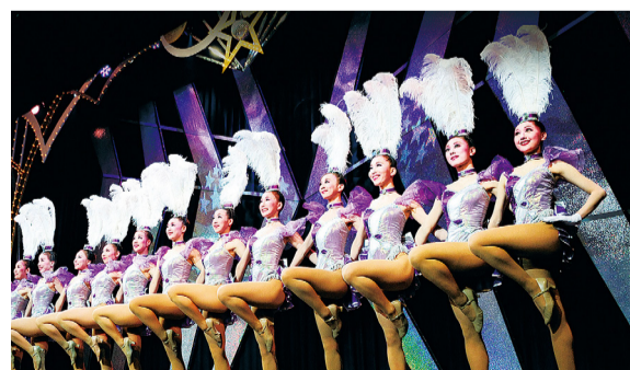
⑤ OSK 日本歌劇團 (示意圖)