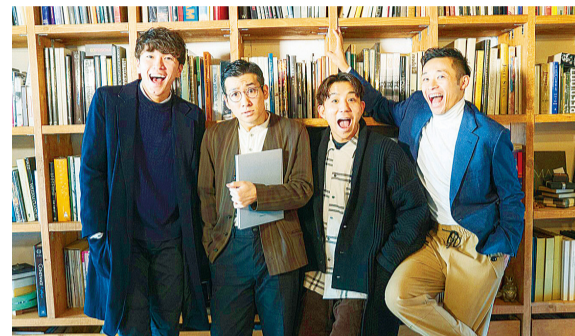
① s**t kingz