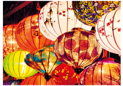
裝點夜晚的「Zoorasia 夜市」(示意圖)