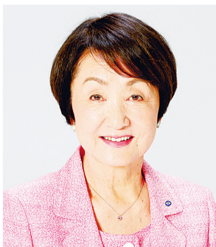
橫濱市長 林 文子

以橫濱的城市為舞台展開的日本最大級別的舞蹈盛典「Dance Dance Dance @ YOKOHAMA 2018」即將拉開帷幕。時隔3年，橫濱的城市將因舞蹈而歡快跳躍。舞蹈盛典於2012年第一次舉辦，每次舉辦活動，都會迎來眾多的參與者。