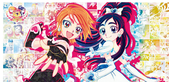
PRECURE 15th ANNIVERSARY!