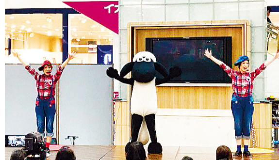
④ 小羊肖恩舞台 (示意圖)