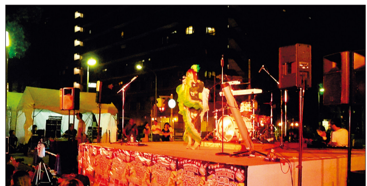
以往舞台活動的情形