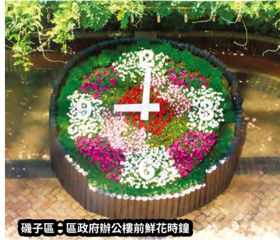
磯子區：區政府辦公樓前鮮花時鐘