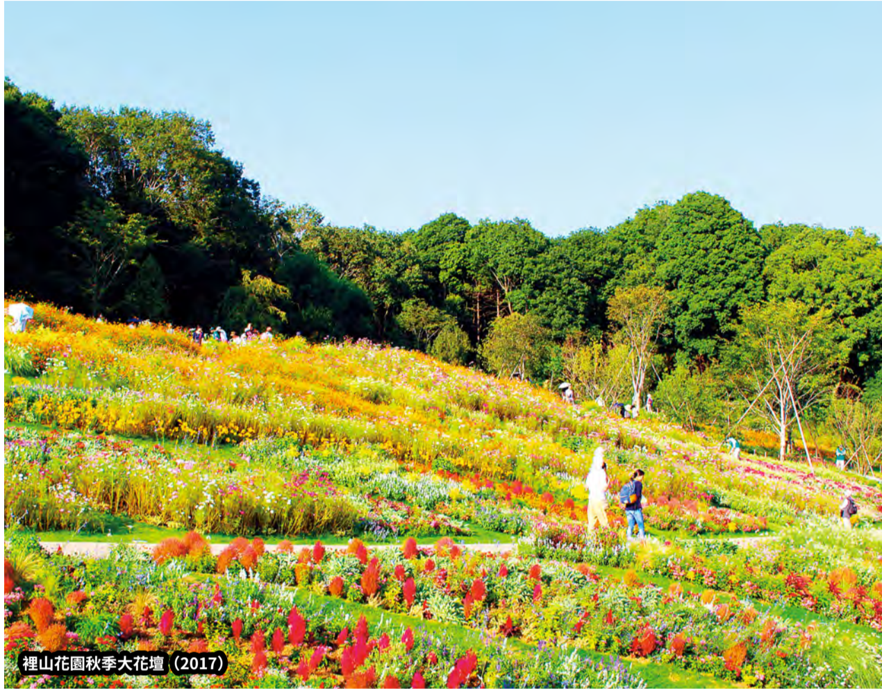
裡山花園秋季大花壇 (2017)