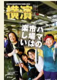
定價 610 日圓