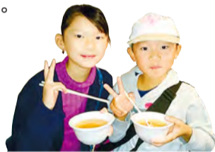
因美味可口而大為滿意

向來場人士免費發送的魚河岸湯汁。根據舉辦日期不同，材料種類也有變化，使用什麼樣的材料，值得期待。