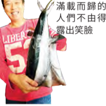
滿載而歸的人們不由得露出笑臉