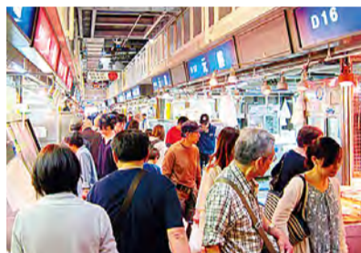
可以購買新鮮的魚類貝類等