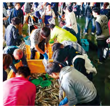
將本港魚裝滿袋子

這是本港魚不限量裝袋優惠活動，產品是在平塚港等橫濱附近的漁港捕撈上岸的新鮮的本港魚類。這絕對可以算是地產地消。根據大海的狀態不同，到貨的魚類種類也有變化，這也是值得一大樂趣。