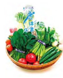
在近郊收穫的新鮮蔬菜