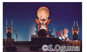
▲ 林英哲特別公演(示意圖)

聯絡地址 實行委員會 電話: 045-663-1365 傳真: 045-663-1928