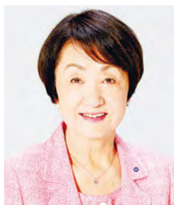
橫濱市長 林 文子

橫濱港開港大型紀念活動可以說是橫濱每年初夏的風物詩。迎來開港一百六十周年紀念的今年，市民及企業、團體都準備將要盛大慶祝。