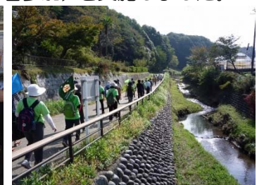
▲ミドリンウォーキング