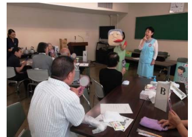
▲お口元気アップ講座

権利擁護や成年後見制度の講演会（5月、342名参加）やケアマネジャー等を対象に「成年後見フォーラム」、民生委員等を対象に、うつに関する研修会を開催しました。