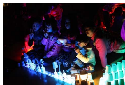
▲スマートイルミネーション新治

区の魅力発信と地域活性化を目的として、スマートイルミネーション新治（11月、来場者約2,800名）を開催しました。また、将来に残したい緑区を記録するため、緑区写真コンテストを実施したほか、新たに、区内に残る歴史的・自然的・文化的地域資源を「緑区遺産」として登録する制度を設けました。