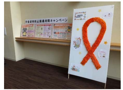
▲児童虐待防止推進月間パネル展

子育て家庭の育児支援を目的に、「赤ちゃん教室」や地域ケアプラザと連携した「プレパパ・プレママ教室」を開催しました。また、市立保育園が中心となり、認可保育所主催でイベントを4か所で開催しました（延 840 名参加）。その他、児童虐待防止の啓発講演会（11 月、152 名参加）やパネル展（10～11 月）を実施しました。