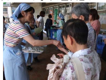
▲地場野菜をおいしく食べようキャンペーン

また、区民まつりではロンドン五輪女子マラソン代表選手によるトークショーやサイン会、スタンプラリーを開催し、約 1,000 人が参加しました。