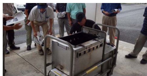
▲移動式炊飯器取扱い講習会

「みどり区ガイド・防災マップ」を7月に全戸配布するとともに、地域防災拠点等で「ペット防災手帳」を活用した啓発も行いました。