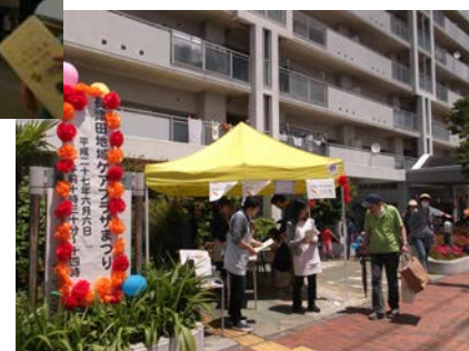
▲ <十日市場地域ケアプラザ 20周年まつり>