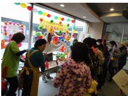
▼<長津田地域ケアプラザまつり>

そして今年、十日市場地域ケアプラザと長津田地域ケアプラザが20周年を迎え、地域と共に歩んできた歴史と共に記念式典を行いました。