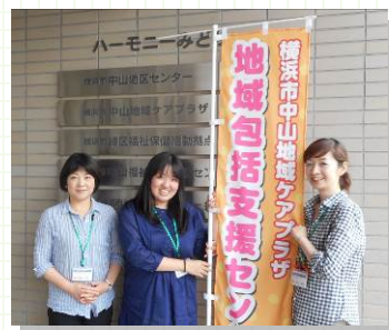
地域包括支援センター