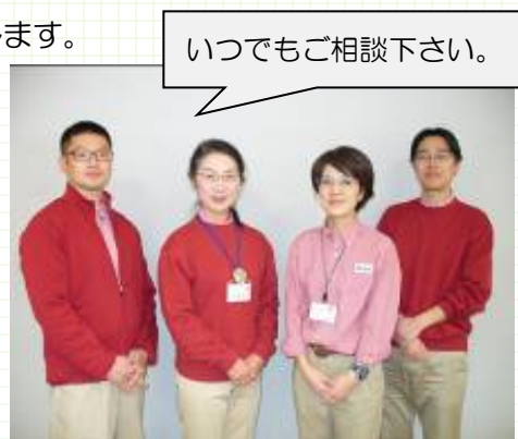
地域包括支援センターと地域交流担当職員

介護保険の申請の手続きなど、介護保険についての相談やご相談者の生活に必要なサービス情報を提供します。