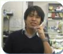
地域活動交流職員