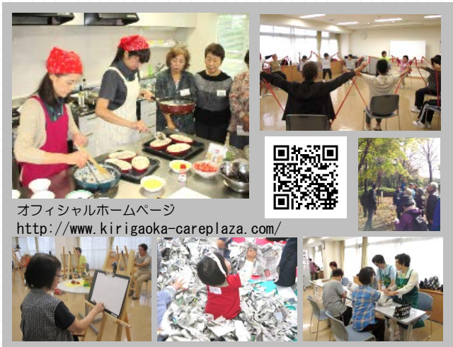
オフィシャルホームページ http://www.kirigaoka-careplaza.com/