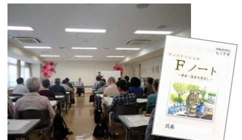
▲古い支度と取組：Fノート講座の様子 （霧が丘地域ケアプラザ）