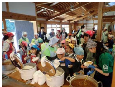
▲「こどもの居場所」イベントの様子 （十日市場地域ケアプラザ）