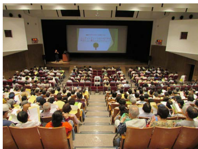
▲エンディングノートPRイベントの様子②