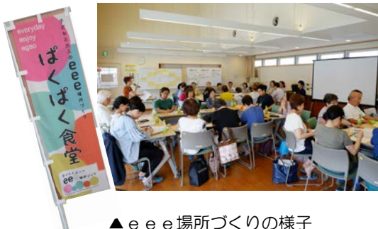
▲e e e場所づくりの様子 （鴨居地域ケアプラザ）