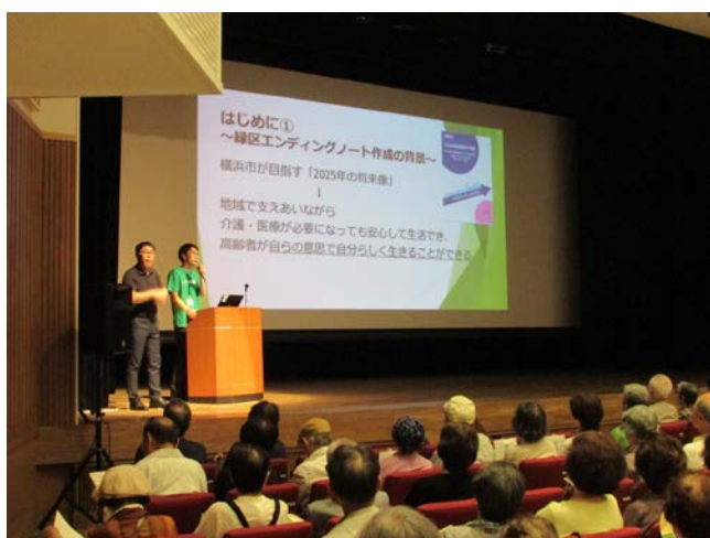
▲エンディングノートPRイベントの様子①