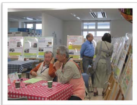
<「みどりのわ・Café」の様子>

第3期計画素案公表期間内には、第2期計画のこれまでの取組と、第3期計画素案を周知するとともに素案への意見募集のために、PRイベント「みどりのわ・Café」を「緑区市民活動支援センターみどりーむ」で開催しました。