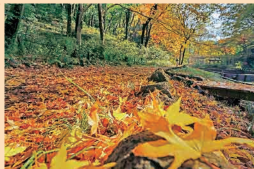
H28年度「晩秋の散歩道」 撮影場所…四季の森公園