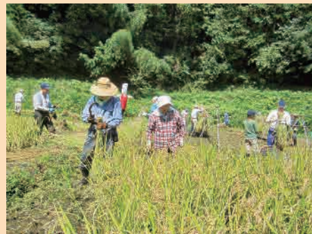
H25年度「新治谷戸の稲刈り」 撮影場所…新治旭谷戸