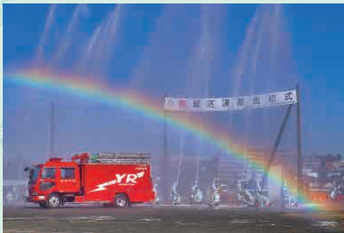
H29年度「虹をかける」 撮影場所…十日市場町消防訓練場