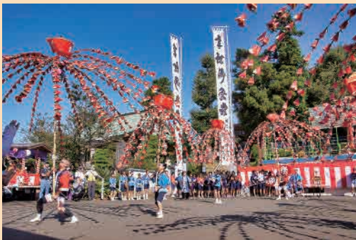
H29年度「秋の華」 撮影者…佐々木純一 撮影場所…中山町杉山神社