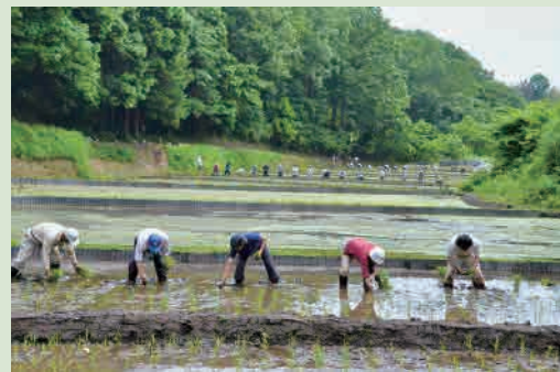
H24年度「みんなで田植え」 撮影場所…新治市民の森の谷戸田