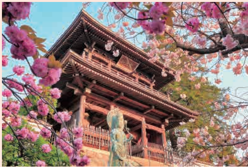
H27年度「満開の桜と輝く寺院」 撮影場所…光照山萬蔵寺