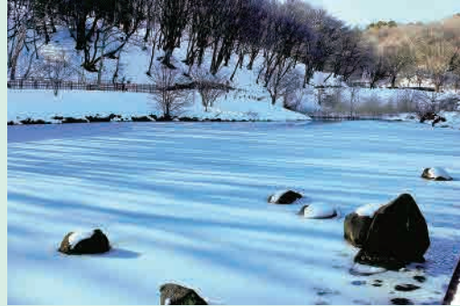
H26年度「はす池氷結」 撮影場所…寺山町四季の森北口はす池前