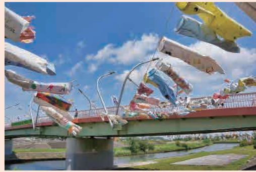
H26年度「子供達の手作り鯉のぼり」 撮影場所…鴨池人道橋