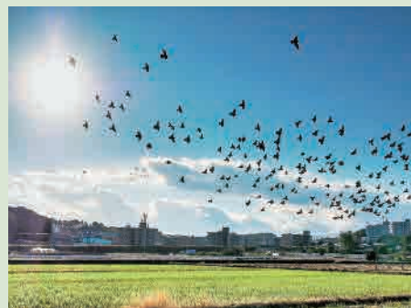
H29年度「舞降りる平和の使い」 撮影場所…小山町観護寺近く