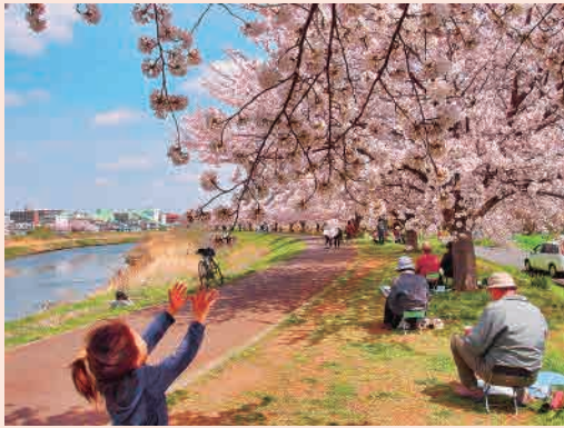
H26年度「満開の木の下で」 撮影場所…鴨居駅前桜並木

緑区の自然や街並み、活動など、今の緑区の姿を記録として将来に残していくため、広く写真を募集するフォトコンテストを平成24～29年度に実施しました。「将来に残したい緑区の姿」として入賞・入選された写真の一部を四季別に紹介します。