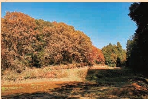
H25年度「新治の秋色」 撮影場所…新治市民の森