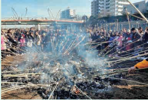
H25年度「もち焼き」 撮影場所…鶴見川鴨居橋下河川敷