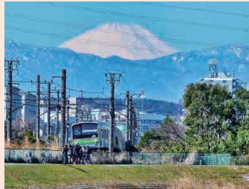
H26年度「富士山と横浜線」 撮影場所…東本郷町（鴨居駅付近）