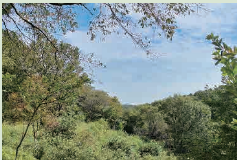
H24年度「森がくれたもの」 撮影場所…新治市民の森