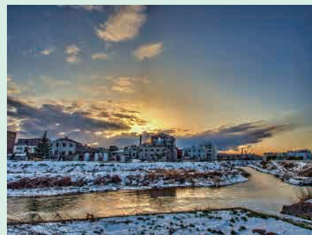
H26年度「雪の日の河川敷散歩」 撮影場所…恩田川と鶴見川の合流地点