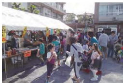
▲新たな多世代交流の場「ひがほん 郷まつり」