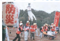
▲防災日本一に向け、「大運動会」でも消防訓練