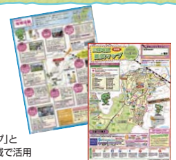
▶「三保地区地域活動マップ」と「防災マップ」を作成、地域で活用