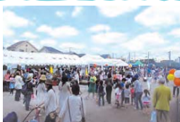
▲「白山福祉まつり」は、バリアフリーに配慮するなど工夫して開催