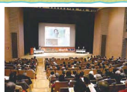
▲「認知症になっても安心して暮らすための映画上映会」を開催