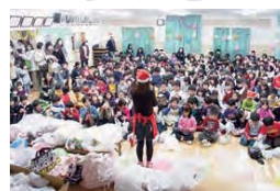
▲顔の見える関係づくりに向けた取組「新治西部のおたのしみ会」