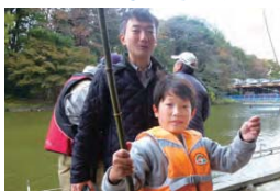
▲竹山地区を活用した世代間交流「親子釣り大会」