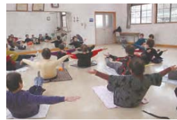
▲つながり介護予防健康づくりの場「元気づくりステーションわくわく」