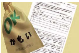
▲災害時の安否確認に役立つ「黄色いリボン」と「鴨居防災ささえあいカード」