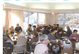
▲地域のつながりの場「十日市場団地お茶飲み会」