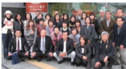
▲防災体験学習施設を訪問

入団する前は男性の活躍する場所かと思っていましたが、実際には女性団員も多く、防災訓練や救命講習など女性の力を発揮できる機会がたくさんあります。研修や勉強会など、女性団員の独自の活動もあります。ぜひ一緒に活動しましょう!