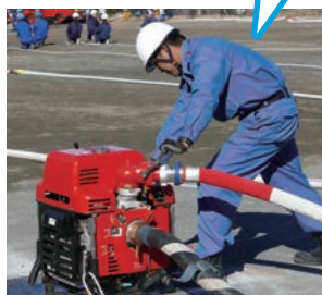
▲可搬式消火ポンプ