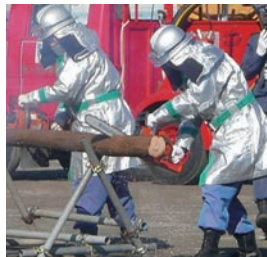
▲建物倒壊時の救助活動などに使用するチェーンソーの実演

消防団が保有する可搬式消火ポンプや救助機材を積んでいる「積載車」は各班に1台ずつ合計18台あります。大規模災害発生時には消防団員が速やかに消火・救助活動を行います。阪神淡路大震災や東日本大震災のときも消防団員が大活躍しています。