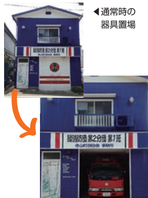
▲シャッターを開けた状態

器具置場は、消防団の活動拠点です。緑区には、班ごとに18の器具置場があります。通常時はシャッターが閉まっています。内部には、可搬式消火ポンプ、人命救助用資機材、積載車などが置かれています。