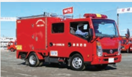
▲可搬式ポンプ積載車

消防団員は消防士と協力して消火・救助活動を行います。消防団員は現場近くに居住・勤務していたり、現場の地理を熟知していたりするため、時には消防士より先に現場に到着し、活動することもあります。