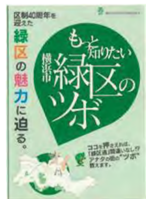
緑区制40周年記念誌