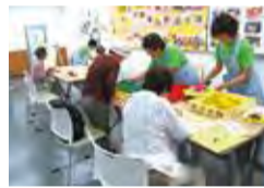
▲食育月間イベント

☐6月22日(土) ☒緑公会堂 ☒緑区食生活改善推進委員会/緑区役所 ☒6月は食育月間。食育推進と野菜摂取量向上に向けた普及啓発を、同じく50周年を迎える食生活等改善推進員と協働で実施します。